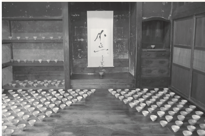
「命のウツワ」プロジェクト 2011

旧天心邸では、大地と水の生々流転をテーマにした近年の白磁大壺を展示するほか、「命のウツワ」のために制作した茶碗の一部を展示します。ご来場のほど、どうぞよろしくお願いいたします。