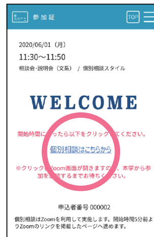
スワイプ後の画面