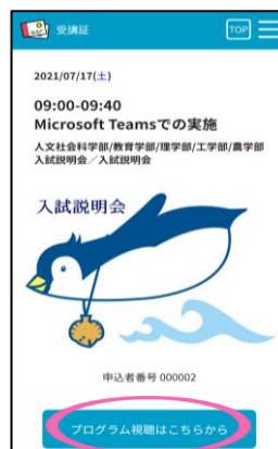
スワイプ後の画面