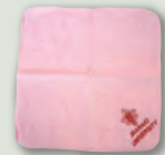
茨大グッズ(Bコース)