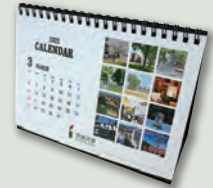
茨大カレンダー(非売品)