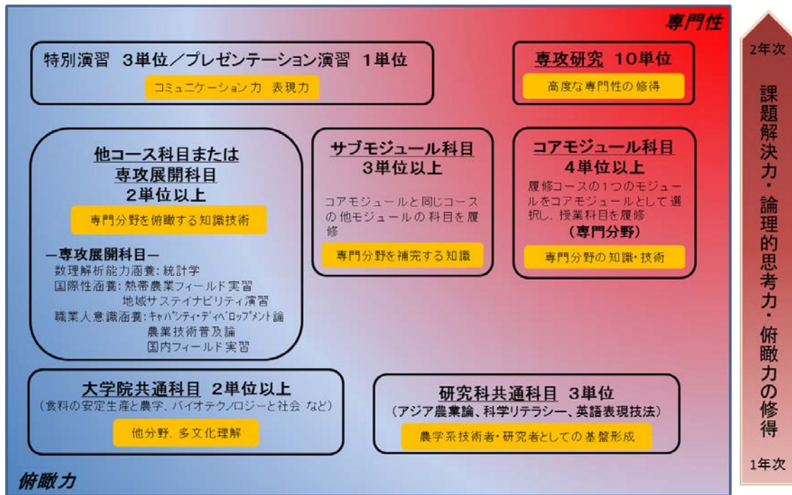
図 コース・モジュール制による履修モデル

以上に記した、大学院共通科目からコース専門科目の履修により修得した高い専門性と技術、多面的な視野により専門分野を俯瞰する能力等に依拠して課題発見、解決力を向上させ、高度専門農学系人材として様々な分野で活躍できる総合力を醸成する。