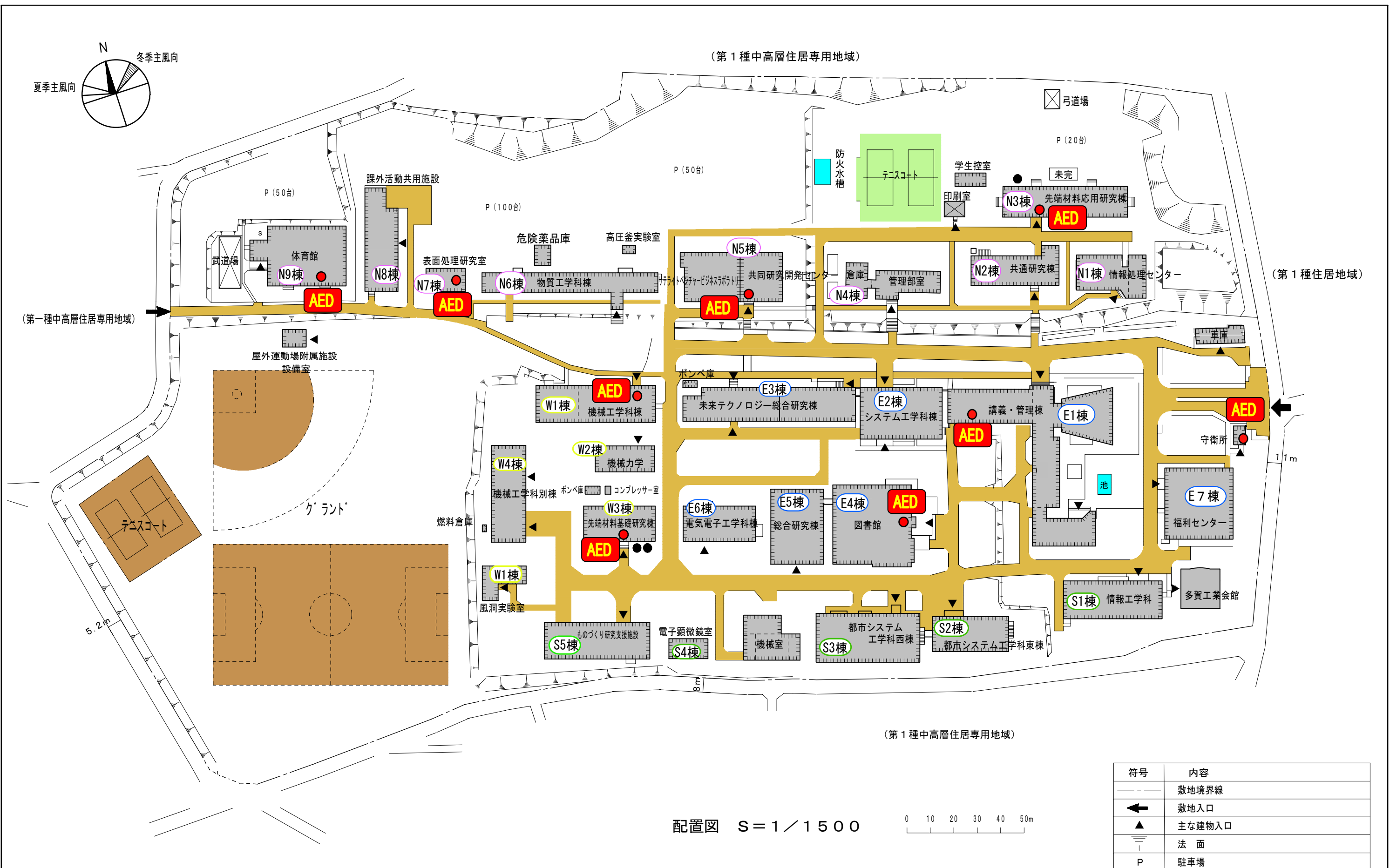
配置図 S = 1 / 1500